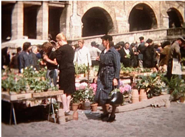
Le marché de Villefranche de Rouergue

Autant de séquences aujourd'hui rassemblées dans un film de 2H10 comportant deux parties ; du printemps à l'automne et de l'automne au printemps, pour constituer un témoignage de la vie rurale, à mi chemin dans le temps entre les films Farrebique et Biquefarre de Georges Rouquier.